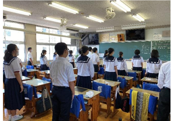
【エアコンの効いた教室での始業式の様子】

改めて、様々な授業や行事の目的や内容、感染症防止対応を再検討した上で、日々の学びを充実させていきます。